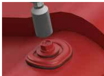
4. Perfekter, stabiler Sitz