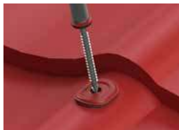
2. Schraube durch Kalotte einschrauben